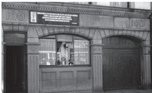
Primer altar de la Legión de María en Myra House (Dublín)

Debemos conocer a María un poco mejor cada día. Cuanto más la conozcamos más entrará en nosotros, y viniendo a nosotros, nos elevará, nos dará más fe, más santidad, nos usará para los propósitos de Dios. Cambiará nuestro carácter, nos dará una nueva personalidad.